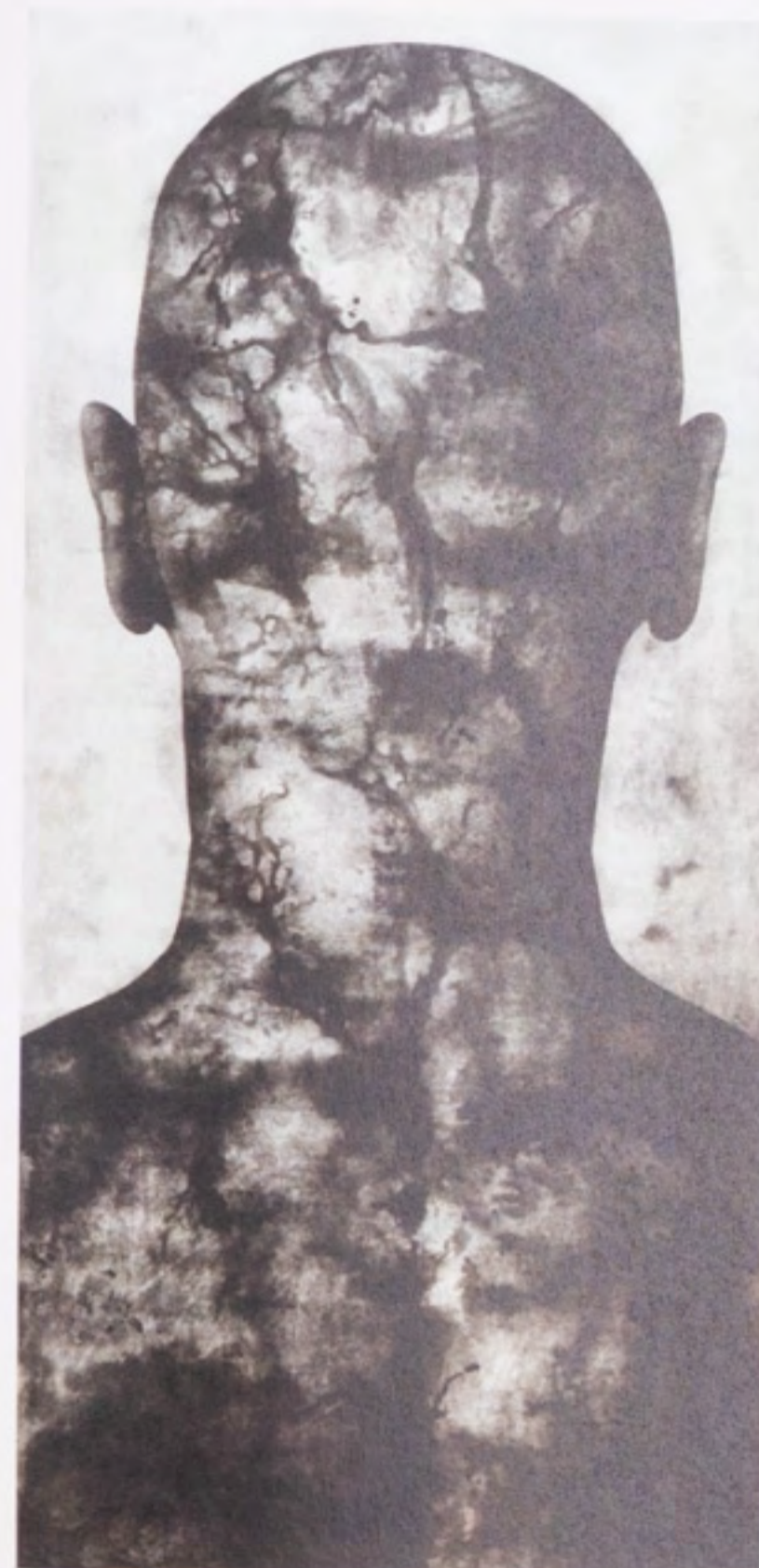
Autoportret – Totem akwatynta 196 x 96 cm 2021