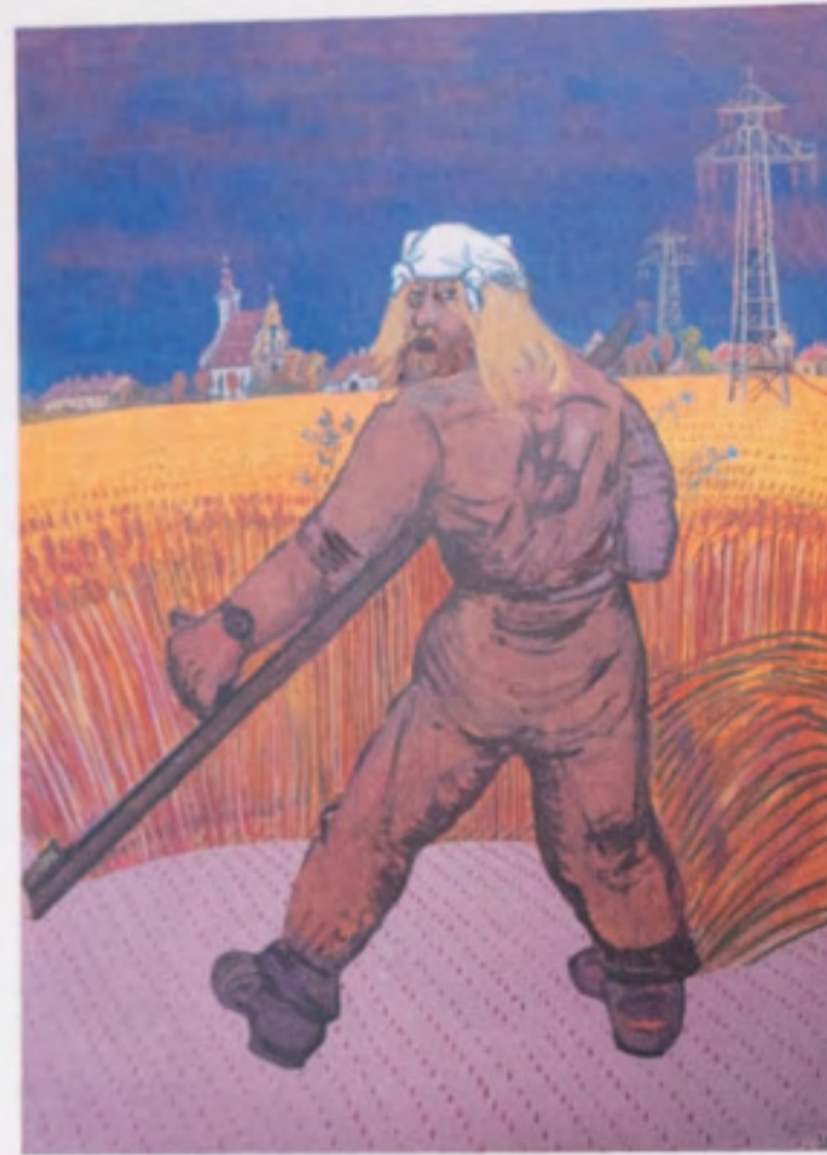
Edward Dwurnik Pszenica z cyklu Sportowcy akryl, olej, płótno 146 x 114 cm 1973

on no Al pr att of ize (K (B an a c th (C th on m Wi I h art art wh in im