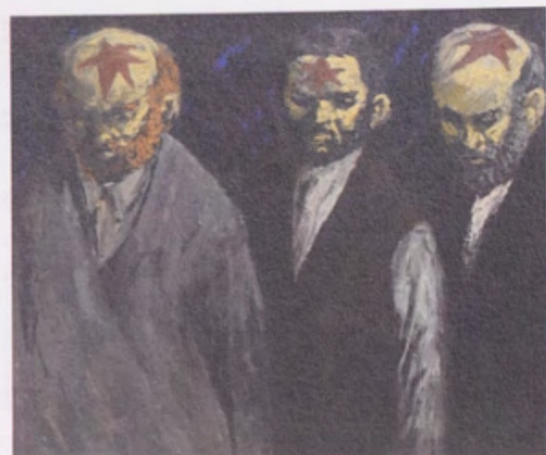
Marek Oberländer Napiętnowani olej, płótno 81 x 100 cm 1955