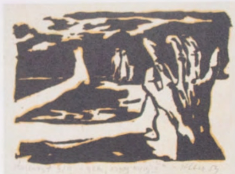
Klem Felchnerowski z cyklu Nigdy więcej II drzeworyt, papier 22 x 30 cm 1954