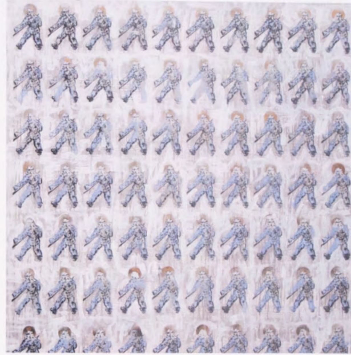
Igrzyska - wszyscy zostaniemy świętymi , z cyklu: Covers szablon, akryl, płótno 150 x 150 cm 2021

“The work was inspired by Edward Dwurnik’s painting from the 1973 series Athletes titled Wheat , which was presented at the 7th National Exhibition and Symposium of the Golden Grape in 1975. The Athletes series, as the author commented, is a story about the fate of a Pole, ‘a little whack job from the communist era’. The Games - We’ll All Become Saints , on the other hand, is a commentary on the present times and the race, in which ‘exceptional’ personalities are constantly created that epitomize ‘mythical, folk wisdom’. They leave an often insignificant but distinct mark, vying for the halo of the extraordinary, and net ‘canonization’ makes them network saints.”