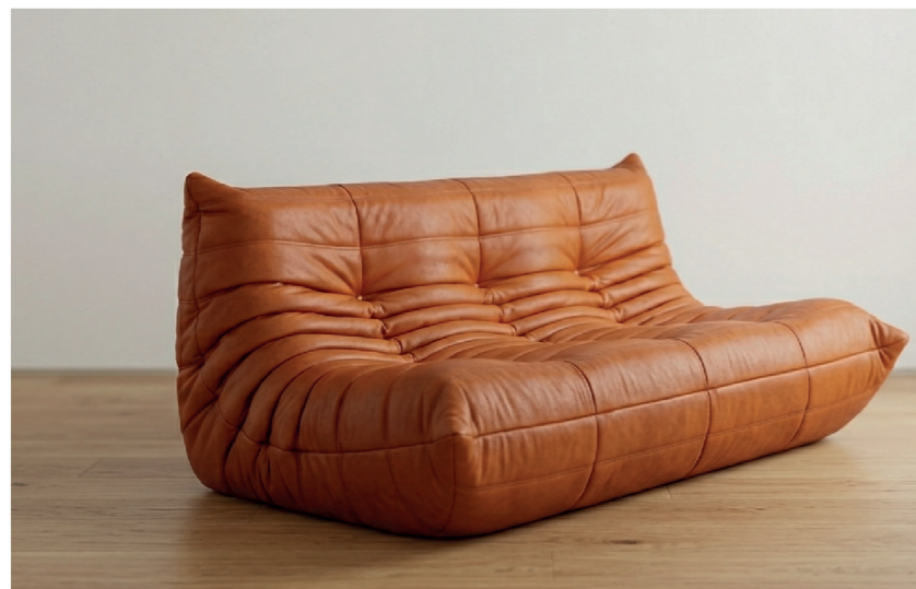
Designerska Sofa Togo, która ma być głównym atutem salonu

Projekt dotyczy aranżacji mieszkania w centrum Wrocławia dla młodej pary miłośników mody i muzyki. Przestrzeń użytkowana będzie głównie w weekendy oraz służyć ma jako miejsce spotkań ze znajomymi. Jest to przestrzeń gdzie para odpoczywa od codziennej rutyny i organizuje imprezy dla najbliższych.